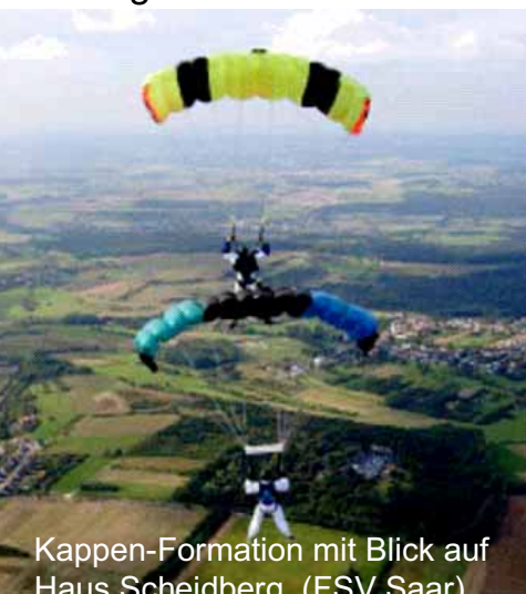
Kappen-Formation mit Blick auf Haus Scheidberg (FSV Saar)

diese Meisterschaft so wichtige Aktion nachhaltig gefördert haben. Die äußeren Rahmenbedingungen mit Wetter und Flugplatz stimmten also und die perfekte Organisation des Fallschirmsportverbandes Saar sorgte für eine Klasse-Stimmung unter den Wettkämpfern. Und tolle Leistungen waren damit vorprogrammiert. In der 4er Freifall Formation gab es einen neuen deutschen Rekord und im Stilspringen einen neuen deutschen Juniorenrekord. Und immer waren saar-