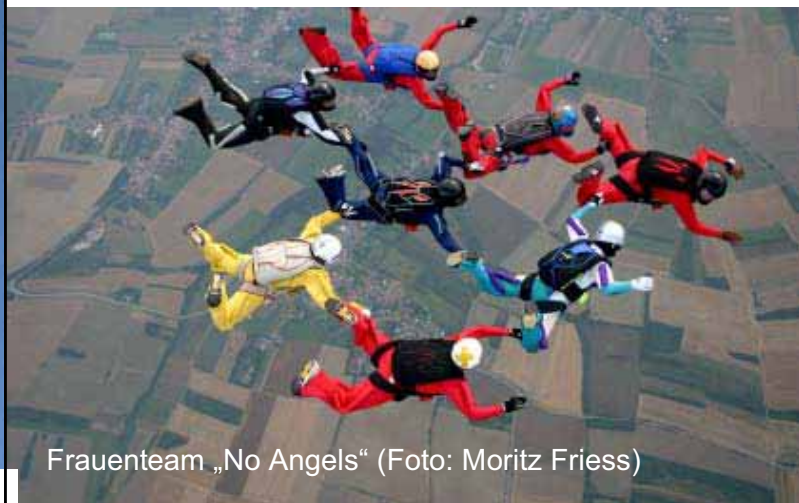
Frauenteam „No Angels“