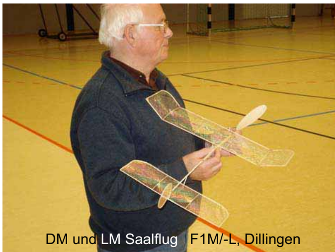
DM und LM Saalflug F1M/-L, Dillingen

Winterflugbetrieb Mitte Dezember im Saarland