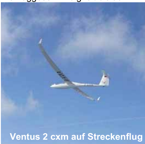
Ventus 2 cxm auf Streckenflug

Ostermontag: Anflug auf den Wendepunkt Mont Blanc Blick aus dem Cockpit in 3500 m Höhe